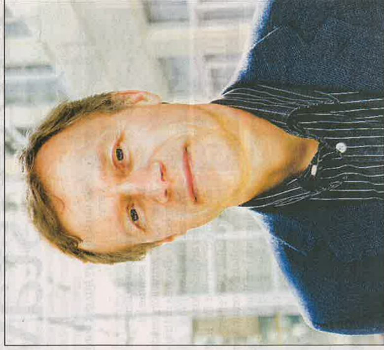
INTENS: Anfinsden mener antirasismen er farlig.

Anfinsden mener tvert imot at evolusjonspsykologisk forskning tyder på at enkelte menneskegrupper ikke kan leve tett sammen. Han