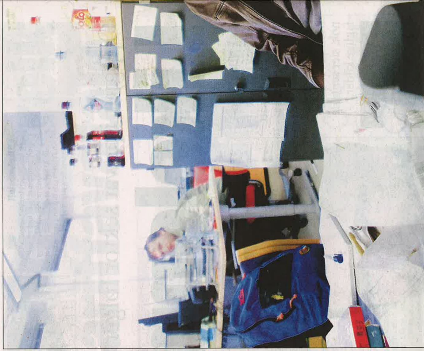
MANGLER EMPIRI: Teoriene om at forskjeller i IQ mellom folkegrupper skyldes genetikk mangler empiri,