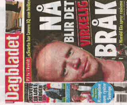
Dagbladet 12. april.